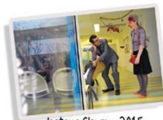
docteur Clown - 2015