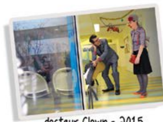
docteur Clown - 2015